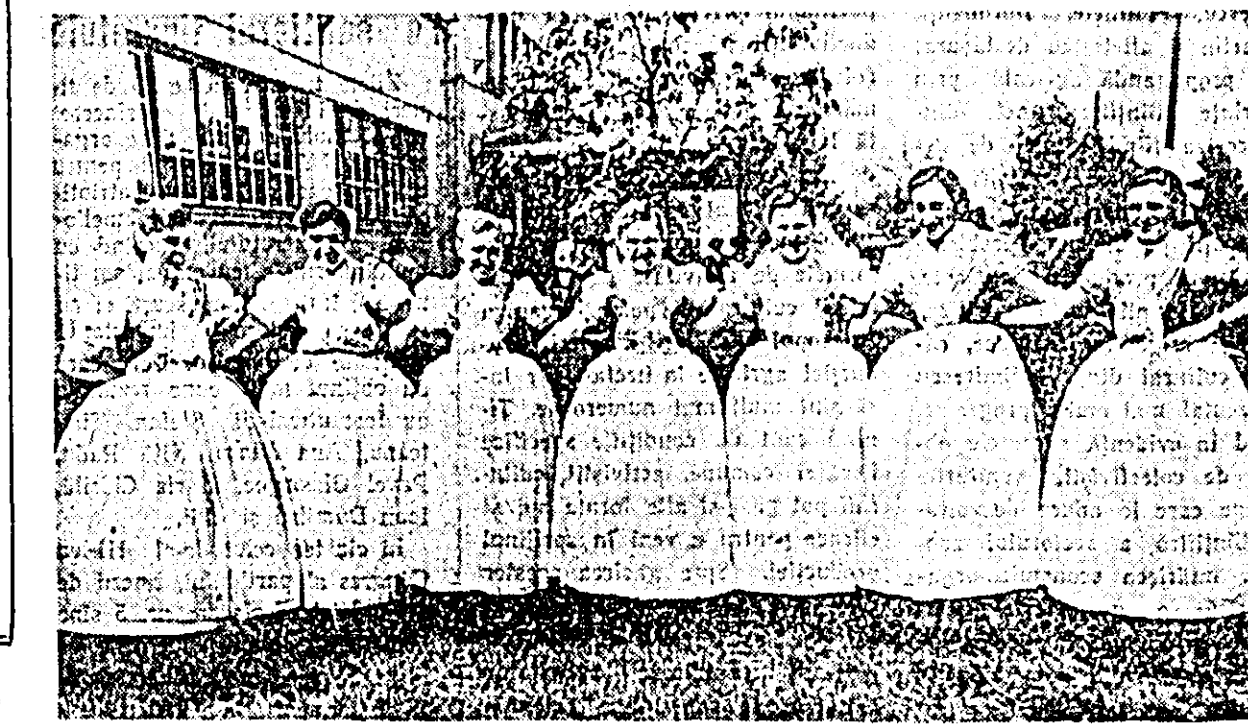
Formațiile de dansuri populare participante la concurs au eucerit nu numai prin măiestria interpretării ci și prin farmecul pitoresc al costumelor.

ÎN FOTOGRAFIE: un grup de dansatoare din comuna Sînmartin în frumoasele costume locale.