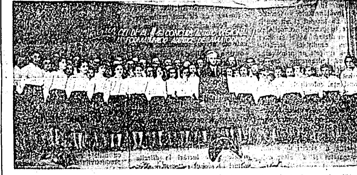
Corul mixt al cîminului cultural din comuna Șiria clasificat pe locul II la faza rațională a celui de al III-lea concurs regional.

Colocivul gazetei de perete a întocmit un grafic trimestrial în care sînt prezăzute materialele ce urmează să apără precum și corespondenții care le vor scrie. Articolele publicate la această gazetă de perete vor-