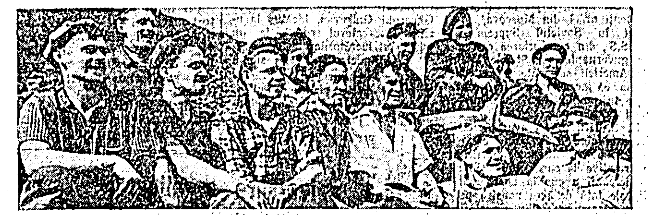
Itați pe eroii entuziaștel munci de construlare a marii hidrocentrale de pe Angara. Prin munca și efanul lor, ei au zăgăzuit uriașul fluviu, a cărui forță poartă acum marea hidrocentrală, dînd țării sovietice milioane de kilovați.

CAIRO 17 (Agerpres). După cum relatează agenția-Franco Presse, la 17 mai a-sosit la Cairo, J. Nehru, pri-mul ministru al Indiei. Pre-miul Nehru va avea întrevede-ri cu președintele Nasser și va-șizita o serie de localități-din Republica Arabă Unită.