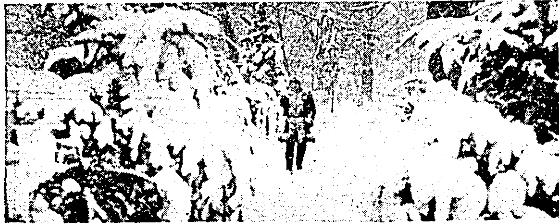
Paisaj de iarnă.