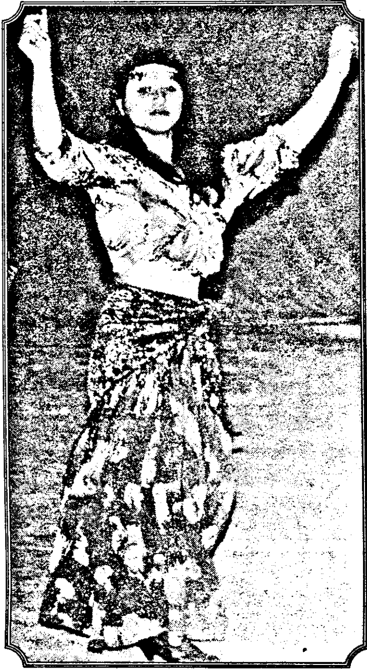
Se întâlnesc, tot mai des, țigani fericiți.

avea convorbiri la externe, am fost contactați de un civil, reprezentant al întreprinderii „Technika”, despre care am aflat mai apoi că are funcția de colonel”, relatează Martin Spegelj. Acesta le-a făcut o ofertă surprinzătoare: să le livreze pistoale automate tip Kalashnikov și muniție la un preț excepțional de avantajos. O armă cu 2000 de cartușe ar fi costat doar 320 de mărci germane față de 700 DM, prețul curent pe piața internațională! DORIN SUCIU (Continuare în pagina a 5-a) ▶