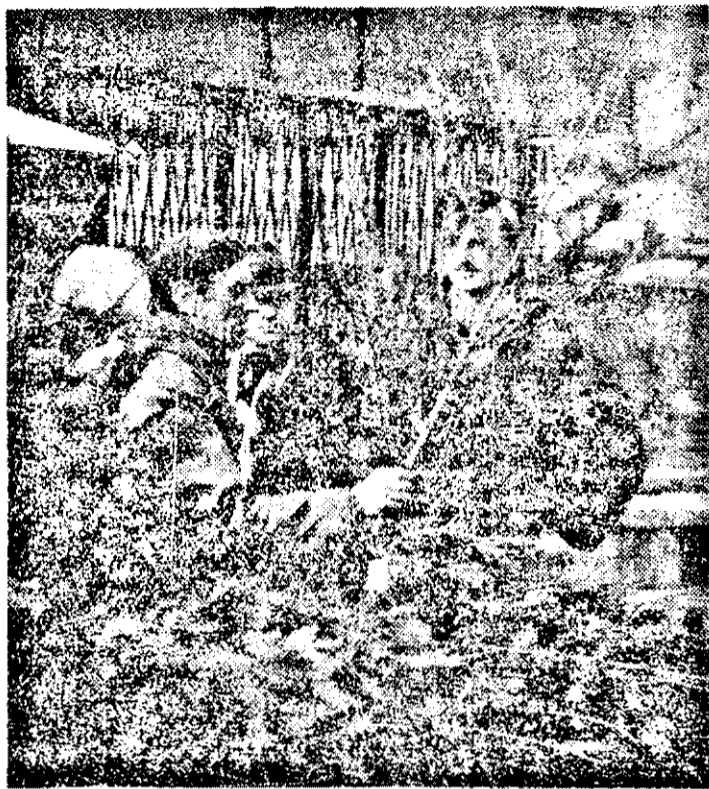
Și brazilii au fost... liberalizați. De aceea, în acest an se poartă... cei mici!