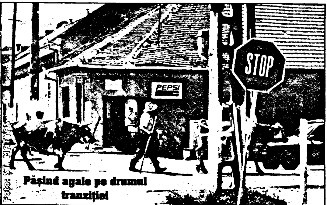
Pașind agale pe drumul tranziției

UN ITALIAN A FOST DEPISTAT CU 22 DE PICTURI PE LEMN FĂRĂ ACTE DE PROVENIENȚĂ , Pag. 6