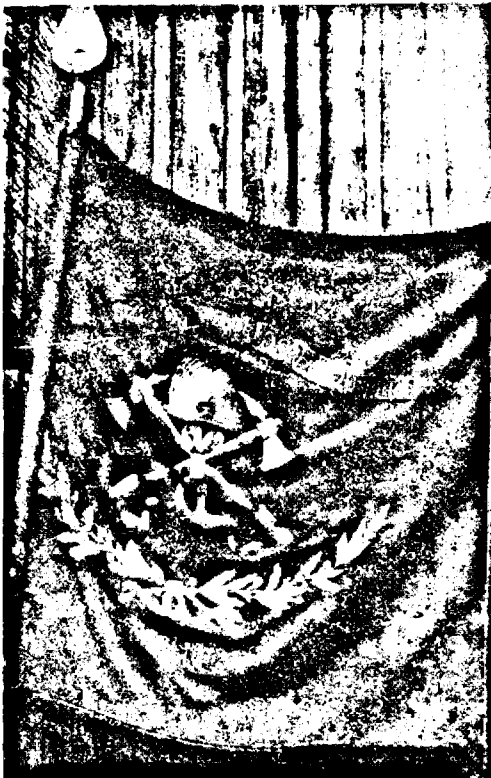
Un steag încărcat de istorie