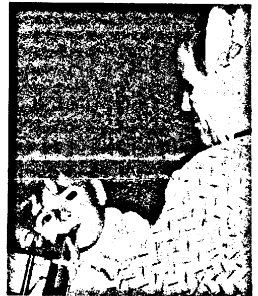
Pe mine nu mă întrebă nimeni?

asociației și ne costă mult. Dar faptul e consumat. În schimb prin presă dorim să facem un apel autorităților locale să ne repartizeze un spațiu adecvat pentru amenajarea noului Centru de Recuperare. Diaconia din Suedia ne va aduce echipamentul de care avem nevoie. După părerea mea, s-a produs o transformare enormă în gîndirea părinților. I-am conștientizat că peste tot în lume cei cu