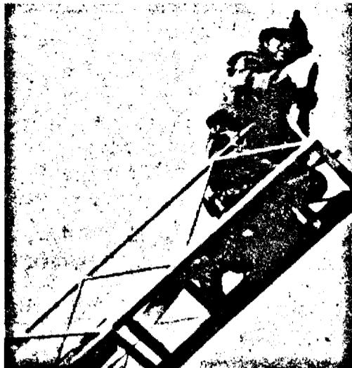
Tinzind spre culmi