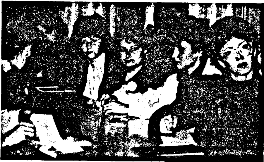
Între curiozitate și speranță.