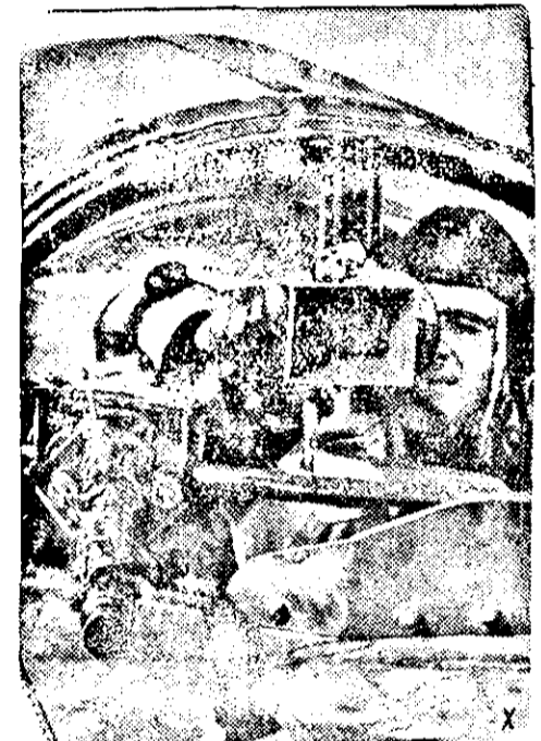
Ein deutscher Kriegsberichterstatter bei der Arbeit