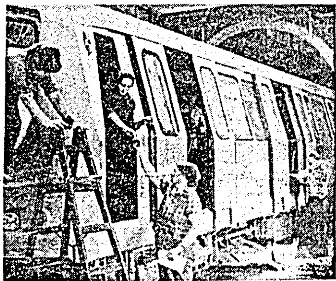
În sectorul II al întreprinderii de vagoane se lucrează la finalizarea unui nou lot de vagoane pentru metrou.

La plecare, cel prezent în fața tovarășului Nicolae Ceaușescu aceeași căldă manifestare de stimă și dragoste, l-au ovaționat îndelung, au scandat cu însuflețire „Ceaușescu—P.C.R.”.