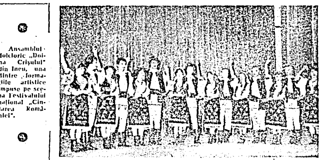
Ansamblul folcloric „Doi-na Crișului“ din Ineu, una dintre formațiile artistice impuse pe scena Festivalului național „Cîntarea României“.