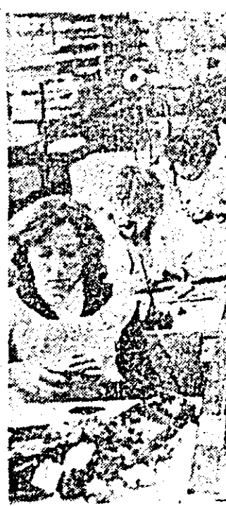
Aspect de muncă de la linia I montaj a întreprinderii de ceasuri „Victoria”.