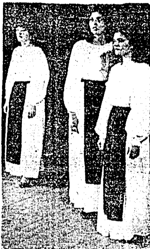
Recitalul de poezie Eminescu, în prezentarea Clubului muncitoresc UTA, la clapa republicană a Festivalului național „Cîntarea României”.