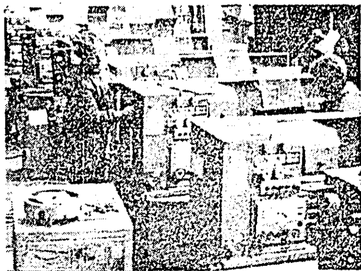
Aspect de muncă în secția montaj a întreprinderii de mașini-unelte Arad.

• Omagierea lui Eminescu în presa arădeană (II) • Manifestări politico-educative • Informații din activitatea organizațiilor de partid • Vremea capricioasă nu-l oșpedică în calea hărniciei oamenilor • Răspundem cititorilor.