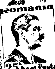
25 bani Poșta

„Impotriva hitlerismului și a fratelui său sovietic nu avem altă linie de rezistență decât creștinismul și întoarcerea la credința care a asigurat Franței un destin etern”.