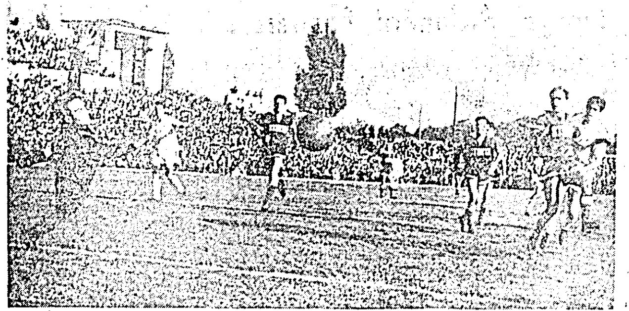
Sut la poarta lui Mogut