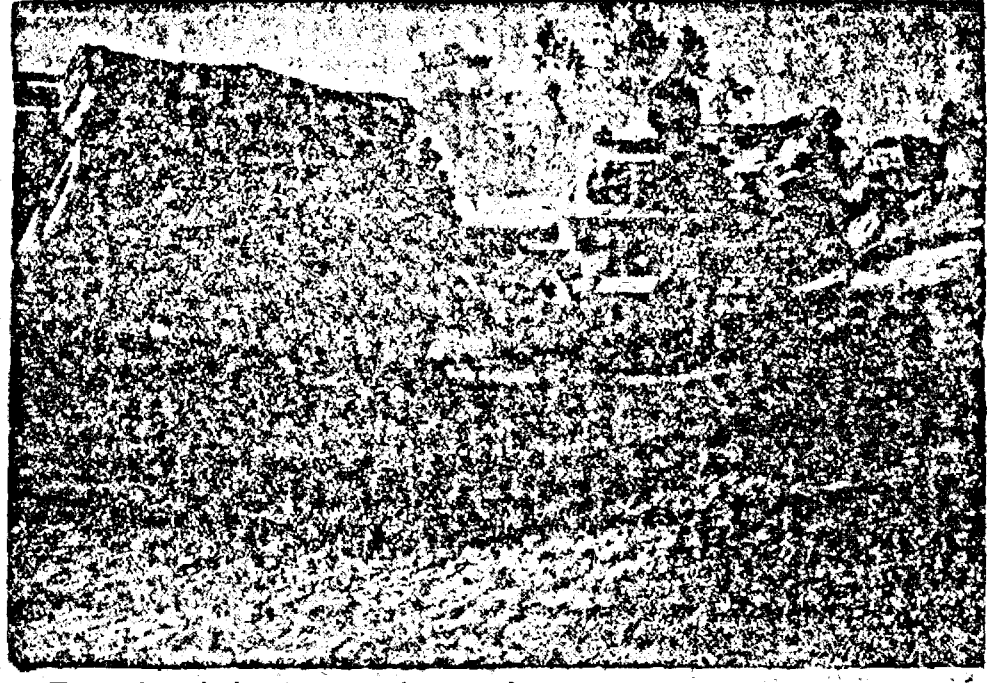
Tancuri sovietice distruse de trupele germano-române în Crimeea

TIPĂRIM ZIARUL ÎN TIPOGRAFIA „TIMIȘOARA” PROPRIETATEA MINISTERULUI PROPAGANDEI, UNDE SE MAI TIPĂRESC ȘI ALTE ZIARE. DIN CAUZA ÎNTĂRZIERII EMISIUNILOR „RADOR” NU PUTEM RESPECTA ANGAJAMENTUL DE TIPĂRIRE ȘI ASTFEL ADUCEM PREJUDICII MATERIALE ȘI TIPOGRAFIEI RUGĂM RESPECTUOS ONOR. MINISTER AL PROPAGANDEI SĂ IA CUVENTELE MĂSURILOR