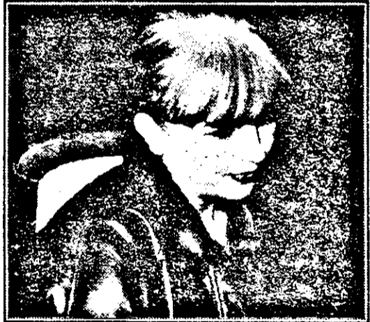
„Îmi place foarte mult ceea ce fac. Cred că pentru asta am fost făcută”.