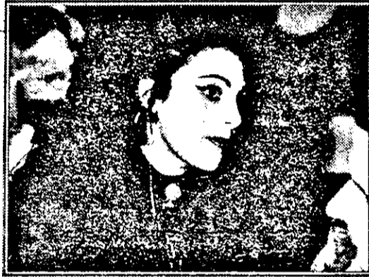
„Vreau să-mi cumpăr un apartament, să-l mobilez și să-mi iau o mașină. Abia după aceea mă voi opri din practicarea prostituției”.