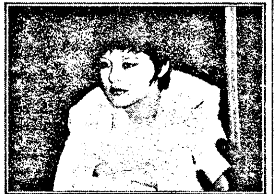
„De la 100-150 DM în sus. Niciodată, sub 100 DM. N-am prieten, dar îți dai seama că nici nu simt nevoia”.