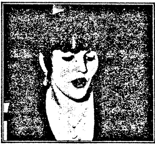
„Nu mă duc decât cu unul pe seară. Vreau să mă protejez...”

vis. Vreau să-mi cumpăr un apartament, să-l mobilez și să-mi iau o mașină.