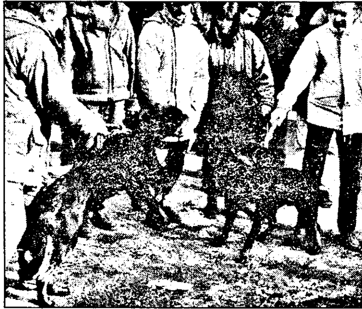
Secvență cotidiană la Piața de animale sau...