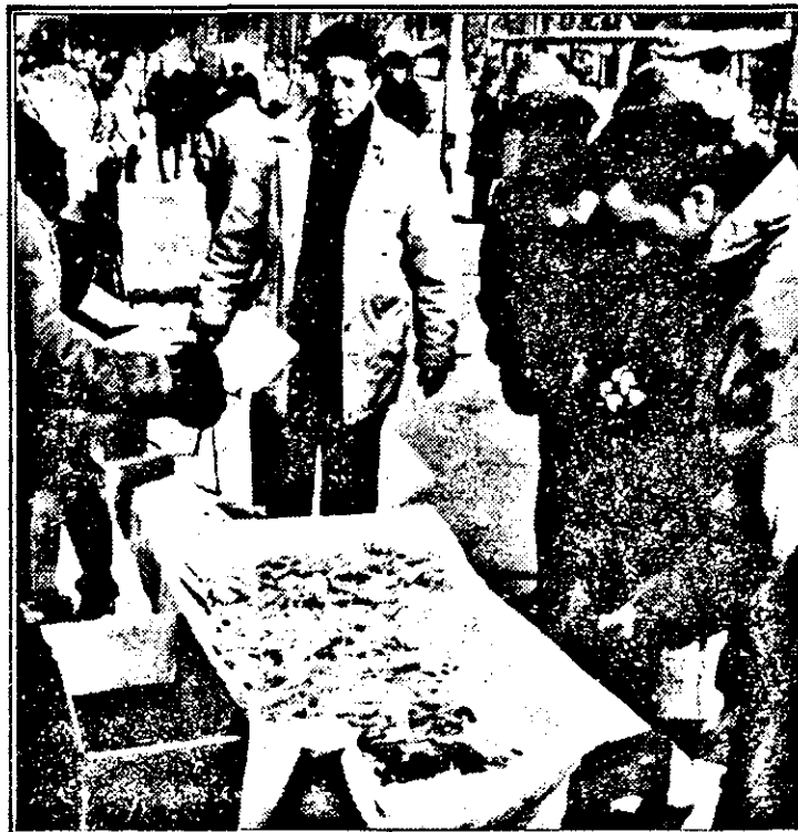
Cu tot frigul de afară... pregătiri pentru „Mărțișor”.