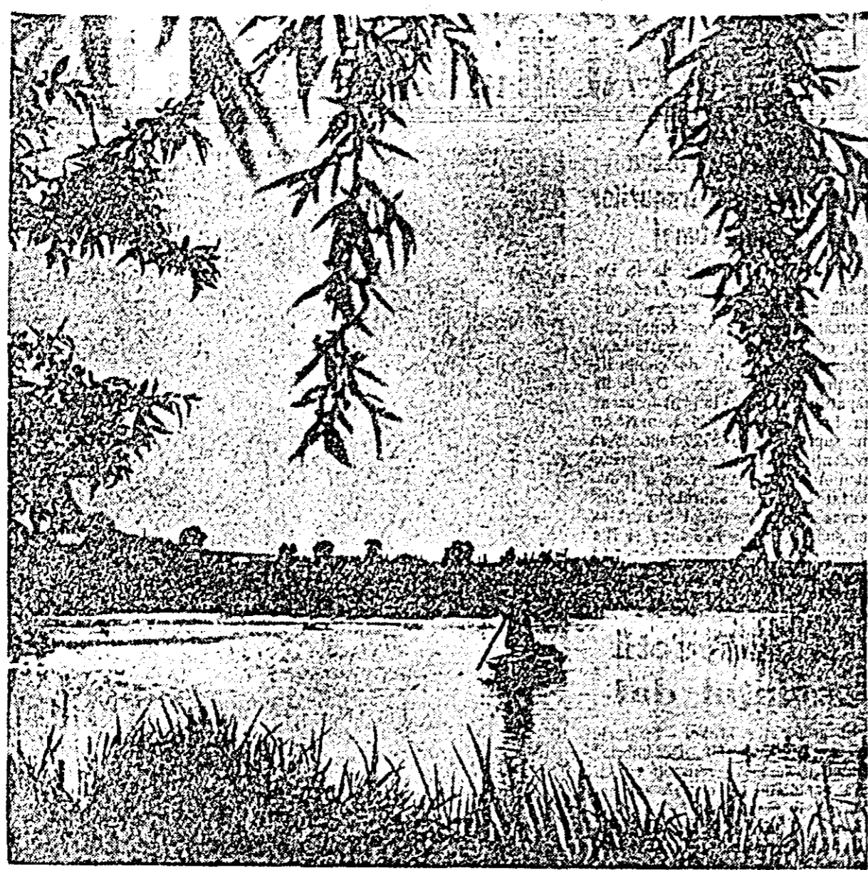
Cu barca, pe-nserat.