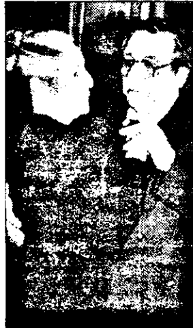
D-l. Tașcă față cu... reacțiunea