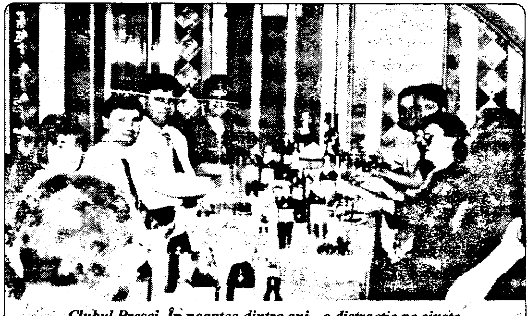
Clubul Presei. În noaptea dintre ani - o distracție pe cinsie, un revelion de neuitat.

pe toți cetățenii țării. Doresc să se întrevadă o îmbunătățire a nivelului de trai începând cu a doua jumătate a anului 1998. Nu sunt foarte mulțumit de anul recent încheiat, de