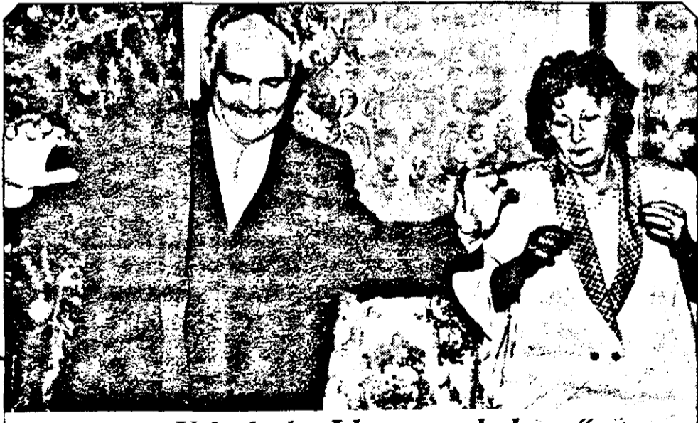
„... U-la-la-la, I love you baby...”

Trecerea dintre ani reprezintă momentul în care facem bilanțul anului încheiat și în același timp ne punem speranțe în cel care vine. Cea mai lungă noapte, la figurat vorbind, noaptea în care artiștii nu mai conțenesc, ne-a dus și pe noi în locurile unde cei care conduc destinele urbei și-au petrecut revelionul. În fața unui pahar cu șampanie, a icrelor negre, a bunățiilor de tot felul, vipurile - cum li se mai spune - s-au distrat care pe unde au apucat. Astoria. Casa de oaspeți de pe strada Horia 6 și Clubul Presei sunt locuri de referință în topul restaurantelor arădene, unde revelionul este la el acasă an de an.