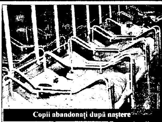
Copiii abandonati după naștere

Din păcate, în cadrul legislativ actual, copilul nu are prea multe variante. Exceptând situațiile în care mamele se răzgândesc, în marea majoritate, copiii, apucă drumul Leagănelui. Problema este însă că nici acolo nu se ajunge prea ușor, în principal din cauza lipsei de spațiu și a altor cauze obiective (epidemii, campania de vaccinare etc.). Așa se face că micuții ajung să aibe o anumită „vechime” în Maternitate.