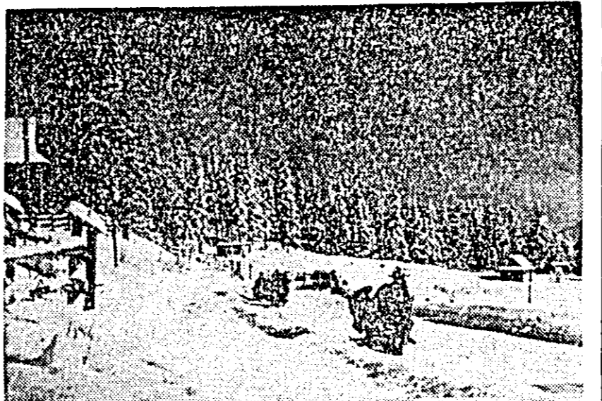
În munşii Tatra.

RESTRICŢIILE DE CIRCULAŢIE IMPUSE SĂPTĂMINA TRECUTĂ de autorităţile izraeliene în oraşul Gaza au fost anulate, anunţă postul de radio izraelian. Aceste măsuri au fost adoptate în urma unor incidente produse în localitatea Gaza. Generalul Moshe Dayan, ministrul izraelian al apărării, însoţit de guvernatorul militar izraelian, a vizitat simbăta după-amiază oraşul Gaza.