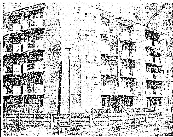
Blocul nou, construit în orașul Chisineu Cris.