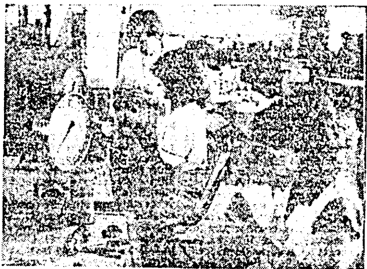
Aspect de muncă în secția montaj a întreprinderii de orologerie industrială Arad.