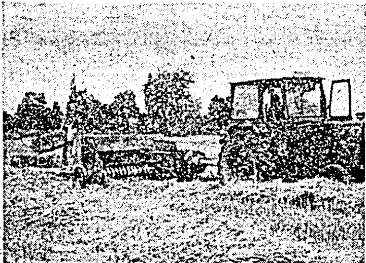
În unitățile din C.U.A.S.C. Chișineu Criș se urgentează eliberatul terenului după recoltatul grâului.