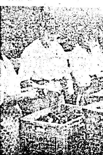
Aspect de muncă la secția de industrializare a C.L.P. Chișineu Criș.

Deosebit de importantă este preocuparea legumicultorilor pentru realizarea pe suprafețe cît mai întinse a unor culturi succesive.