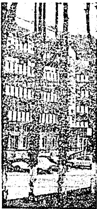
Moneasa. Vedere a noului hotel al U.N.C.A.P.