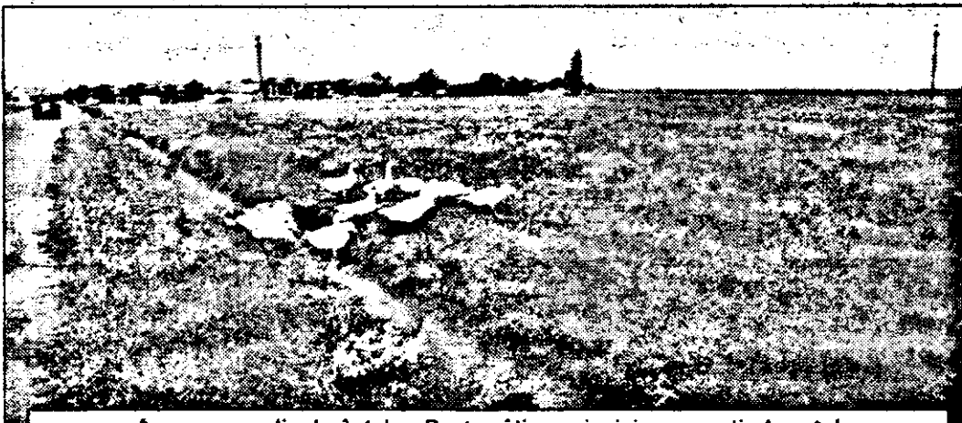
Acum e paradisul găștelor. Peste câțiva ani, aici se va extinde satul