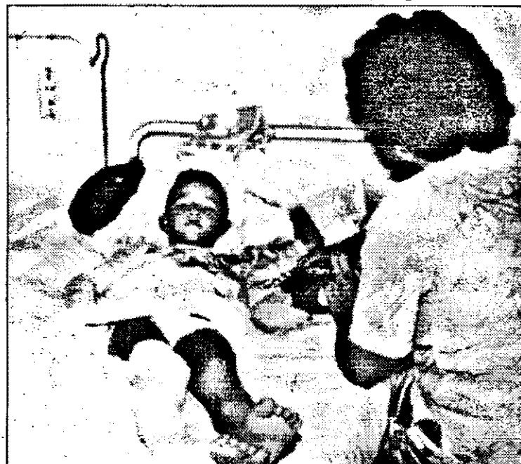
Pentru mamele care se internează cu copiii nu sunt create nici un fel de condiții