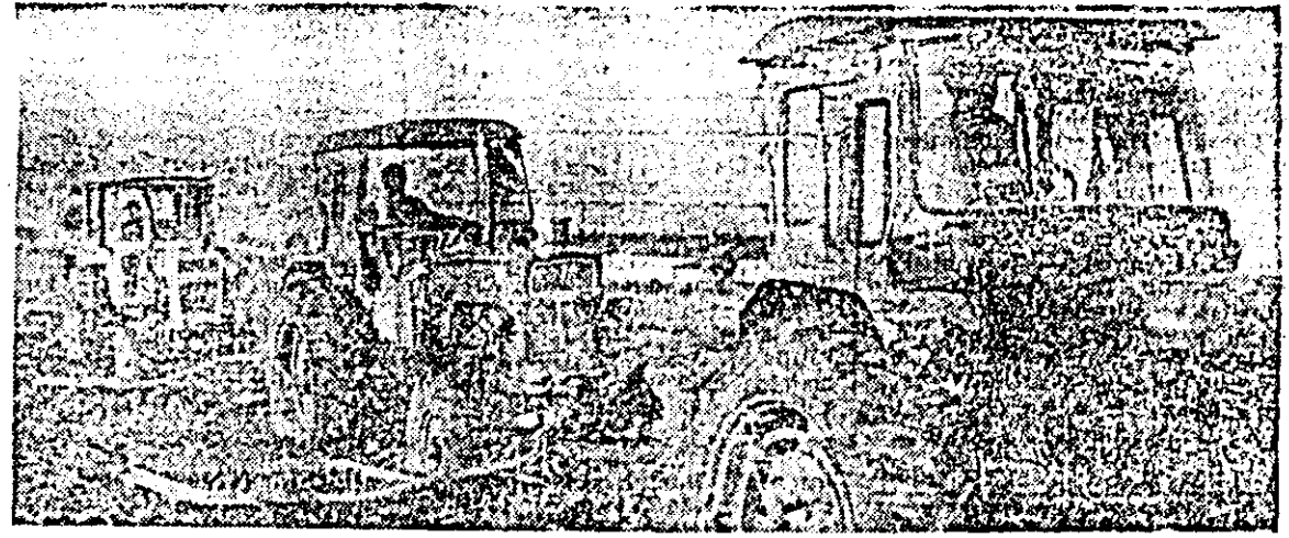
Pe ogoarele cooperativei agricole de producție Maccea se lucrează intens la pregătirea terenului pentru însămînțările de toamnă.

telui (10 000 bucăți ceasornice) luat pentru întregul an. ÎNTEPRINDEREA TEXTILA U.T.A. Insușeșita întrecerea socialistă ce se desfășoară în rîndul colectivului de muncă de la Întreprinderea textilă U.T.A. se constituie ca un puternic stimulator în obținerea unor rezultate superioare în muncă. Ca urmare, de azi, textiliștii arădeni se înscriu în rîndul colectivelor de muncă care și-au îndeplinit înainte de termen sarcinile de plan pe primele nouă luni ale anului, perioadă pe care o încheie cu un bilanț rodnic. Ei însumează, între altele, o producție industrială suplimentară în valoare de 12,5 milioane lei, realizarea în plus a 120 000 m.p. țesături finste, 750 000 m.p. țesături crude și altele.