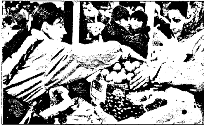
- Aș lua și struguri, dar la 25.000... Mai bine mai aștept până se fac 30.000!