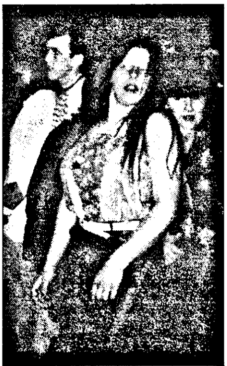
Tineretele din Cermeci consideră discoteca „Flamingo” „cel mai bun lucru ce se putea întâmpla la Cermeci”.