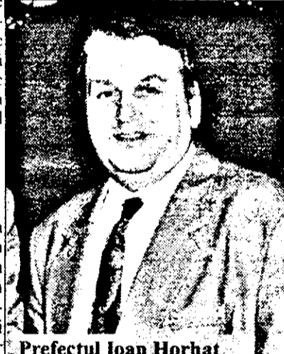
Prefectul Ioan Horhat