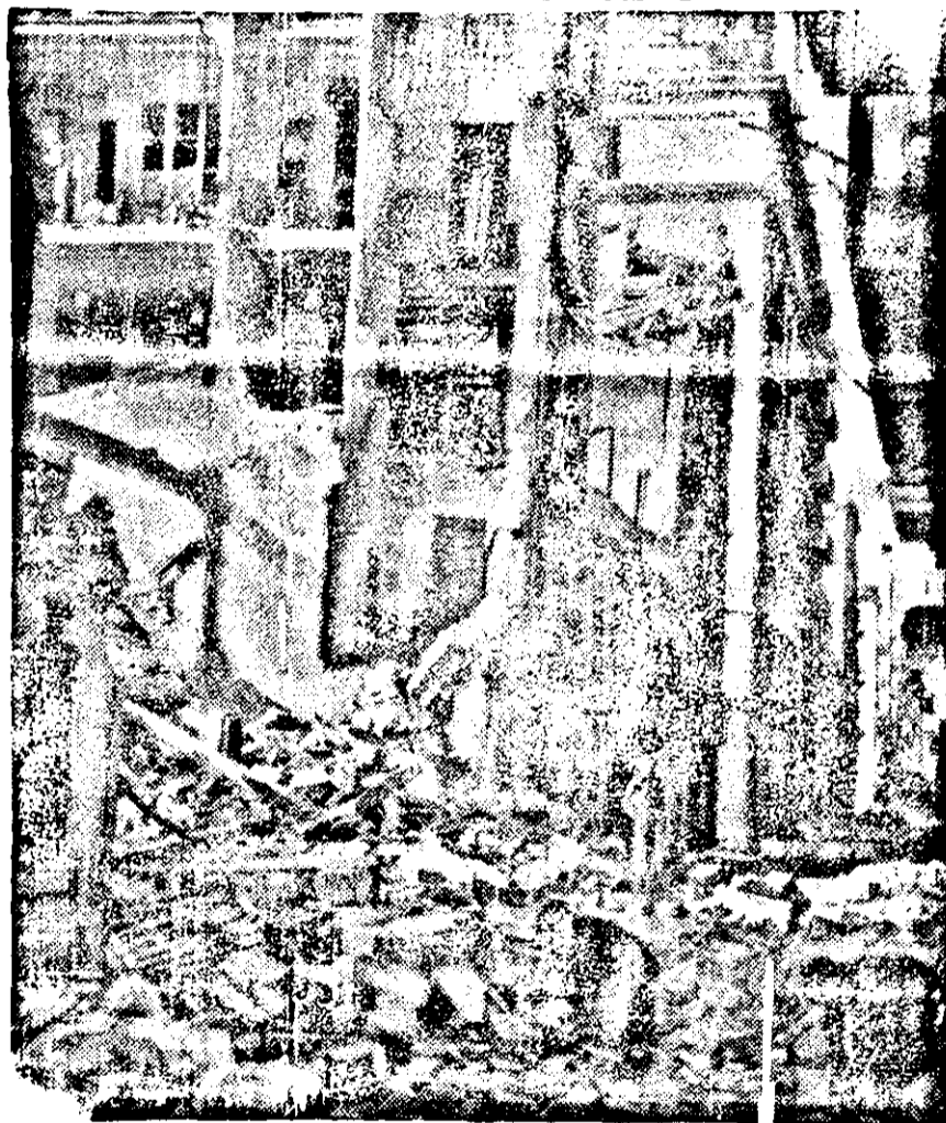
So fanden viele Einwohner Barcelonas ihre Häuser wieder

Hust. Die Sabas Agentur berichtet, daß es bei Jrsava zwischen den ungarischen und Karpathorussischen Truppen zu einem heftigen Kampf kam und die ungarische Einheiten zurückgeschlagen wurden. Eine spätere Meldung besagt, daß der Gegenangriff der Ungarn von Erfolg war und die Truppen nunmehr ungehindert vorwärts schreiten. Wolosin ist geflüchtet.