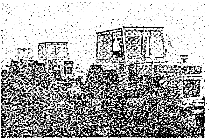
În aceste zile, pe ogoarele județului, se execută arăturile de toamnă.