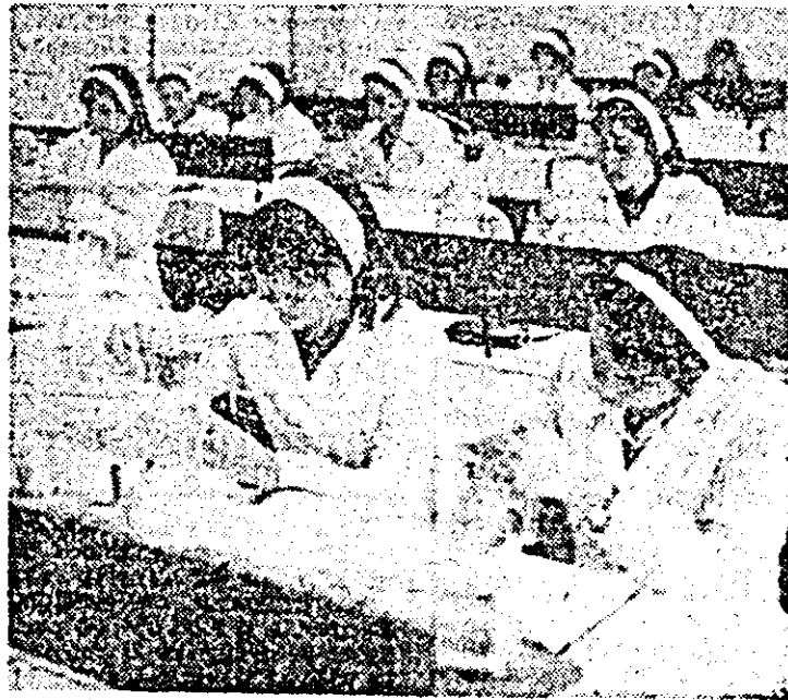
În unul din laboratoarele de chimie ale Liceului Industrial nr. 4, elevii își formează deprinderi de lucru necesare pentru viitoarele cadre ale industriei chimice arădene.