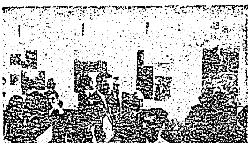
JAPONIA. Instantaneu de la Expoziția cu aspecte din România, deschisă recent în clădirea San-al, Ginza, Tokio, organizată de Asociația de prietenie japoano-română.