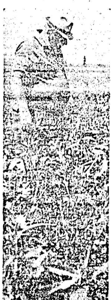
La C.A.P. Răpsig în căutarea sîcicel prîntre buruieni.

lui, cu teren jos, unde a bălăcit apa. Și în luncă e însămintat porumb, dar e atît de slab încît puține speranțe sînt