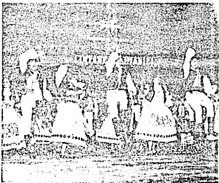
Formația de dansuri populare a întreprinderii de mătase pe scena Festivalului „Cântarea României”.

tate. S-au multiplicat, de asemenea, în spiritul politicii culturale a partidului și statului nostru, interferențele între arta profesionistă și arta amatoare, cu efecte pozitive în creșterea calității artistice. Deci, la capătul a doi ani de eforturi și pregătiri artistice, cultura arădeană va etala pe scena finală a festivalului „Cântarea României” tot ceea ce are mai valoros. Astfel, avem bucuria să înformăm cititorii ziarului nostru, în mod deosebit pe toți iubitorii de frumos, că printre orașele gazdă ale etapei finale se numără și municipiul nostru. Iar prin îndurările de față adresăm o caldă invitație la primul spectacol-concurs ce va avea loc astăzi, 28 iunie, începând cu ora 17, cînd pe scena Palatului cultural vor evolua în fața juriului republican (sosit la Arad) cele mai bune orchestre, formații, grupuri și interpreți de muzică populară și fanfare promovate în etapa finală de pe întreg cuprinsul județului nostru.