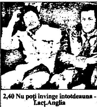
2,40 Nu poți învinge întotdeauna - fact. Anglia

10,05 Alf - s.dis.anim-reluare 10,30 Vaporul iubirii - reluare 11,25 Vecinii - s.aus.