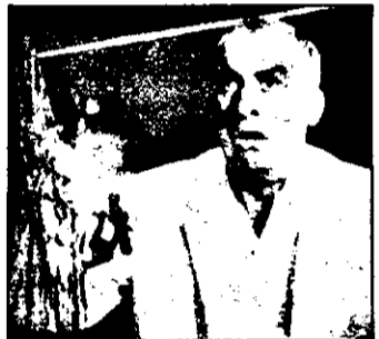
17,10 Jandarmul din Saint Tropez - c. Franța

8,30 Prezentarea progr. 8,32 Aștept oaspeti 9,02 Școala lui Iuliei