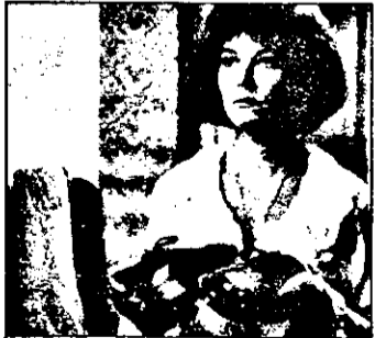
0,35 Îmi iubesc sora - film SUA, 1977

8,15 Lumea afacerilor 8,30 Buletin financiar 8,45 Afaceri la zi