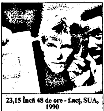
23,15 Încă 48 de ore - fact. SUA, 1990

14,00 Actualități 14,10 Maurice Ravel - Muzică de cameră 15,30 Colacul de salvare - Tineretea un handicap?