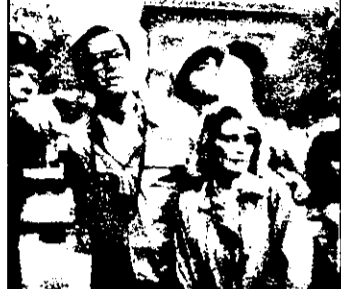
21,15 Ajutor, vin nebunii!

12,00 Mag. politic 13,00 Baschet NBA 13,55 Black Beauty - s. canadian.