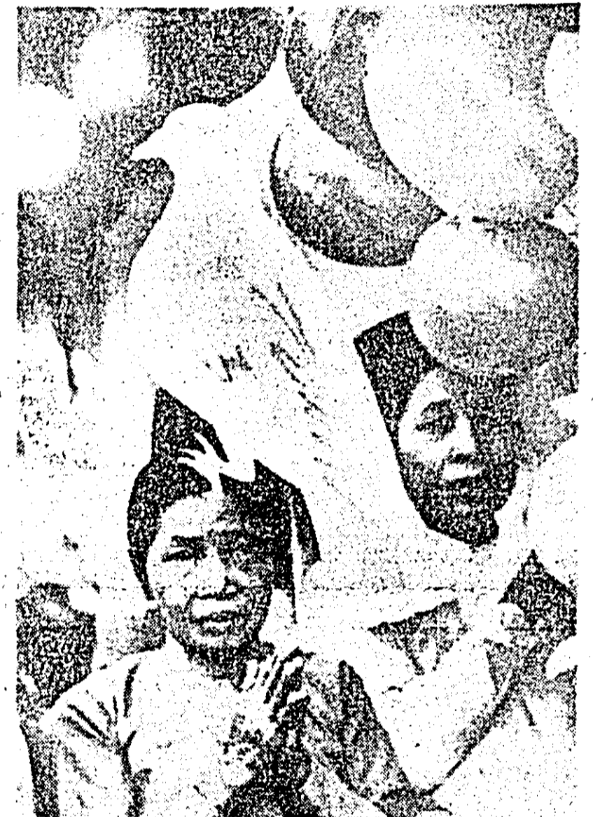
Opoziția față de regimul fan tomă de la Saigon — a cărui instabilitate continuă să se accentueze cu fiecare zi ce trece — se manifestă nu numai în lupta armată a patrioților împotriva trupelor acestui regim și a celor intervenționiste ci și prin alte numeroase și diverse acțiuni ale populației — mitinguri, demonstrații, greve, organizații clandestine în oraș etc. Fotografia prezintă o imagine din timpul unei procesiuni budiste, desfășurată recent pe străzile Saigonului, în cursul căreia grupuri de femei au lansat băloane cu heliu, pe care era înscris cuvîntul „Pace” și desene cu simbolul ei — Porumbelul.

La lucrările congresului asistă delegații ale partidelor comuniste și muncitorești frățești, reprezentanți ai unor partide socialiste, mișcări și organizații democratice, antiimperialiste. Partidul Comunist Român este reprezentat de o delegație condusă de tovarășul Paul Niculescu-Mizil, membru al Comitetului Executiv, al Prezidiului Permanent, secretar al C.C. al P.C.R. Congresul Partidului Comunist Italian se înscrie în viața politică a țării ca un eveniment de mare însemnătate, datorită atât forței și influenței sale în rândurile maselor de oameni ai muncii, în-