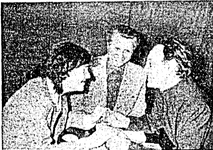
Secvență din spectacolul cu piesa „Refacerea” vieții” de Ion Bălesu, pe scena Teatrului popular din Ineu.

se-nțelege, au reușit chiar să desfășoare o întreagă stagiune de teatru în acest oraș cu atâtea apetente culturale. În stagiunea 1982-1983, de pildă, nu mai puțin de cinci piese — cele două amintite, plus „La o piatră de hotar” de I. D. Sîrbu, „Refacerea vieții” și „Gărgărița” ambele de Ion Bălesu au văzut lumina rampei inecuan. E extraordinar, dacă ne gândim că nici un teatru nu montează într-un an, mai mult de 7-8 premieri! Chiar pentru stagiunea prezentă repertoriul Teatrului popular din Ineu cuprinde piese noi cum sînt „Crimă pe palier” de I. Bălesu, „Reînălțirea” de Radu F. Alexandru, „Anotimpuri” de I. D. Sîrbu și „Eroica” de Florin Drăghic — o nouă creație a talentelor ce dau viață teatrului la Ineu. Să mai adăugăm că trupa de astăzi a teatrului inean, ajunsă la circa 15 membri activi, susține spectacole la căminele culturale din jur — la Beliu, Tirnova, Pincota, Birsa etc. — că publicul său e în creștere, mai ales din partea tineretului, pare-se câștigat definitiv pentru idee — și avem o scurtă „biografie” de succes, de viabilitate și, de ce nu? — de strălucire a unei inițiative și a unei pasiuni consecvente.