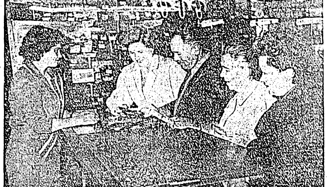
O mare aliuță de cumpărători cunoaște în aceste zile și magazinul „Cadouri” al OCL „Produse Industriale”. Iată-l în clișeu pe noul cumpărător alegîndu-și ceasuri, cărora le-au fost reduse prețurile.