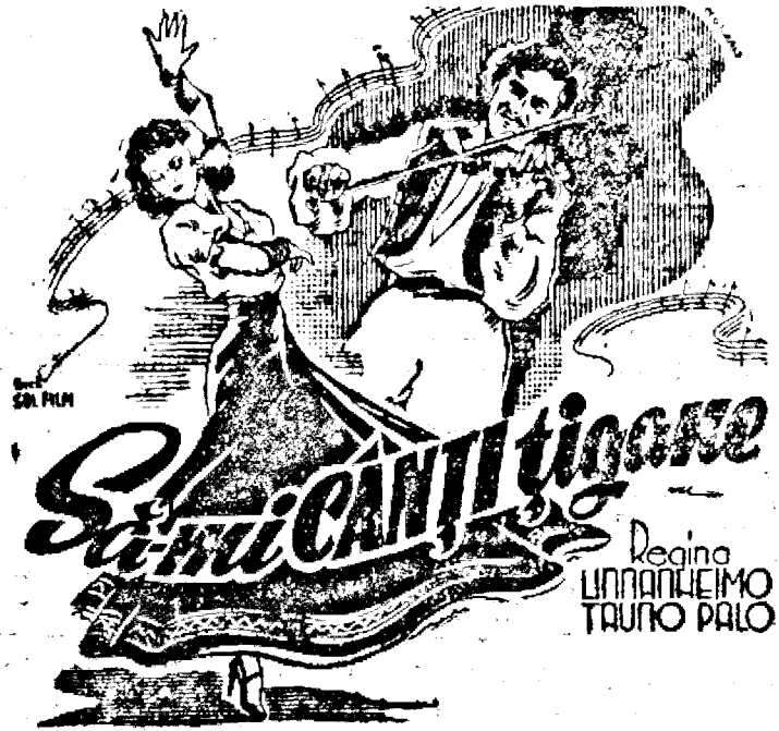
Mător, Duminecă ultima oară

Filmele filmelor Luni, 21 Ianuarie 1944 MUZICA, DRAGOSTE, SENZAȚIE, AVENTURI, DANS