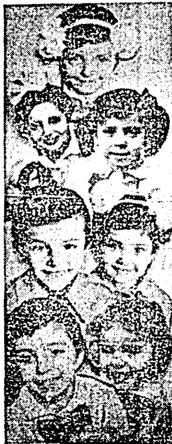
„Zimbetele primăverii”.