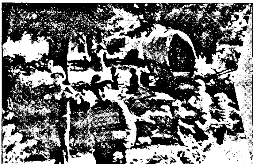
◆◆◆ Și la Arad am întâlnit... țigani fericiți ◆◆◆

Postal, deoarece din zona unde acesta răspundea de corespondență, a primit astfel de sesizări. La intervenția organelor de poliție, Mihalyczek a fost găsit cu 16 plicuri deschise, iar el își recunoaște fapta, precizează sursa citată. În cele 16 scrisori nu au fost expediate sume în valută.