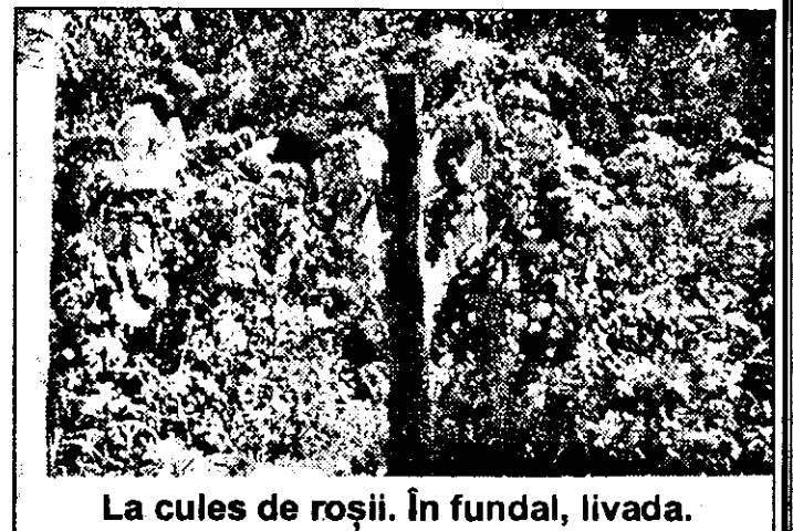
La cules de roșii. În fundal, livada.

prăsilă. Cresc 50-60 de curci, 100 de găște, rațe bibilici, găini. În aceste condiții un profit anual de 40-50 milioane de lei.