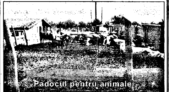
Padocul pentru animale