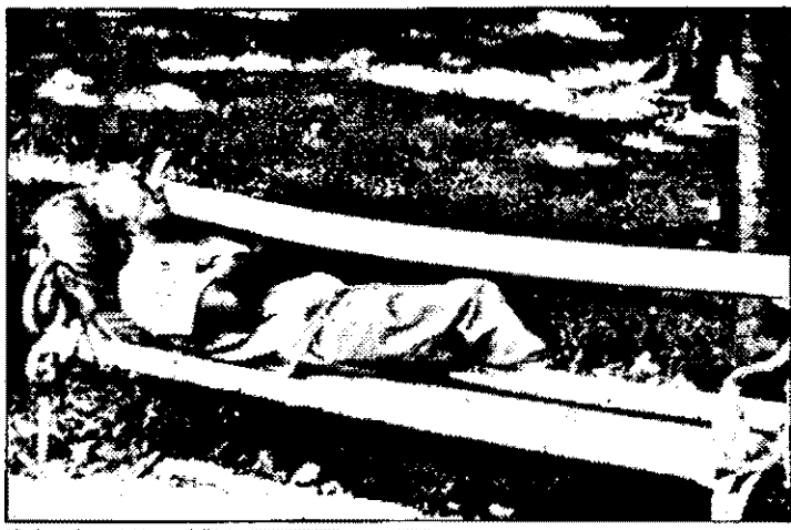
Somn ușor, române!