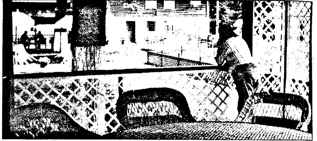
Hanul „DEZNA”, un posibil popas la sfârșit de săptămână