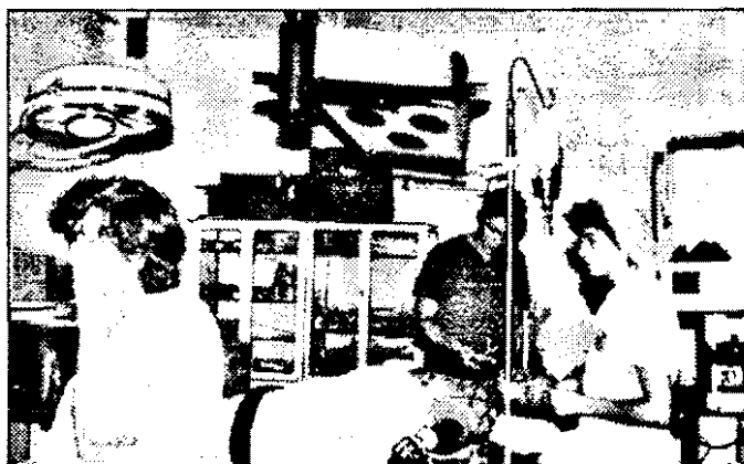
Operațiile decurg greu la 40° C

În saloanele Spitalului Județean, la orele amiezii, e tot atât de cald ca afară. Bolnavii abia găsesc câteva locuri la umbră, ca să scape de toro-