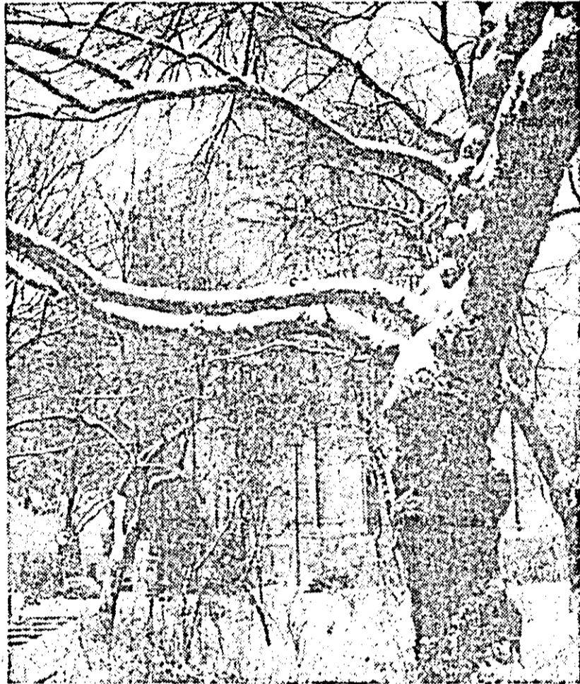
Impresie de iarnă.