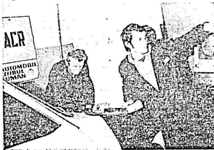
Se execută testarea mașinilor.

ției organizațiilor democratice și unității socialiste la acțiunile cu caracter preventiv în circulația rutieră, corelația dintre psihologie și siguranța circulației, oboseala la volan, implicațiile medicale ale accidentelor rutiere, consecințele juridice ale încălcării regulilor de circulație, particularitățile conduitei preventive în circulația rutieră în sezonul rece. Au fost prezentate, de asemenea, aspecte din experiența Școlii de șoferi profesioniști din Arad în pregătirea viitorilor conducători auto, opiniile unor conducători auto cu experiență îndebăzută la volan, precum și un film pe teme de circulație. Cu același prilej a fost difuzat ultimul număr al foii volante „Om, drum, mașină” editată de serviciul circulației al Miliției județului Arad, în colaborare cu A.C.R., întreprinderea de transporturi auto și I.J.T.L. Arad.