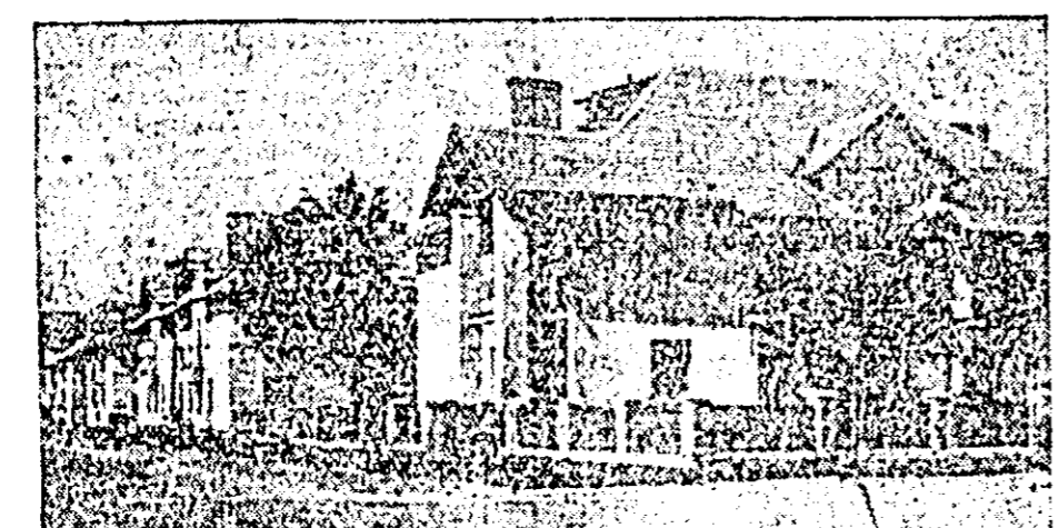
În clișeu: Orașul estonian Kohla—larve. Strada Victoria

Dar, nu numai centrul raional, ci și întregul raion Gorodișce dispune de o rețea largă de instituții cultural-educative. În raion funcționează 17 cluburi sătești și șase cluburi colhoznice, 19 biblioteci. Rețeaua de radiodifuziune a luat o largă dezvoltare. În cinci cluburi sătești au fost instalate aparatele cinematografice permanente, iar acolo unde nu există asemenea aparate, vine cu regularitate caravana cinematografică. În fiecare sat funcționează un grup de lectori. La Gorodișce au fost deschise două librării,