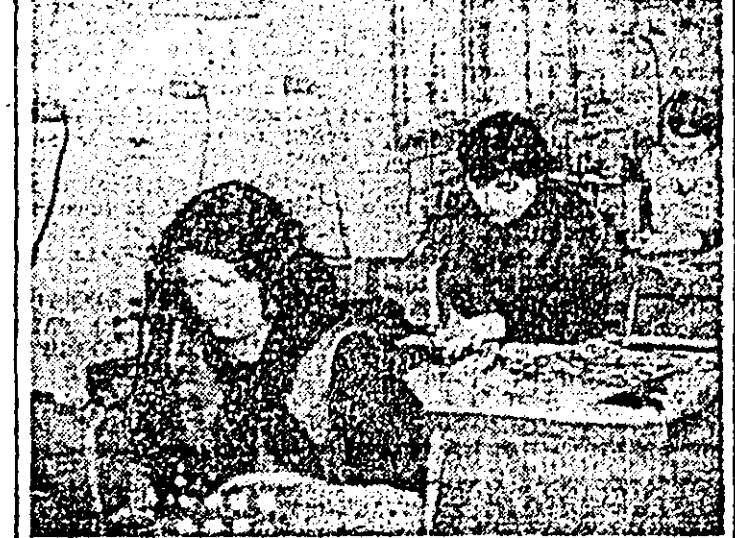
Aspect de muncă în secția umbrelor a întreprinderii de vagoane metalice.

călători, clasa a II-a, cu caracteristici tehnico-funcționale superioare. Astfel, se remarcă design-ul modern al vagonului, calitatea ridicată a finisajelor interioare, noul sistem de încălzire — prin suflare de aer cald, dotarea vagonului cu instalație de sonorizare. Totodată, trebuie evidențiat faptul că noul tip de vagon este realizat în totalitate cu componente indigene.