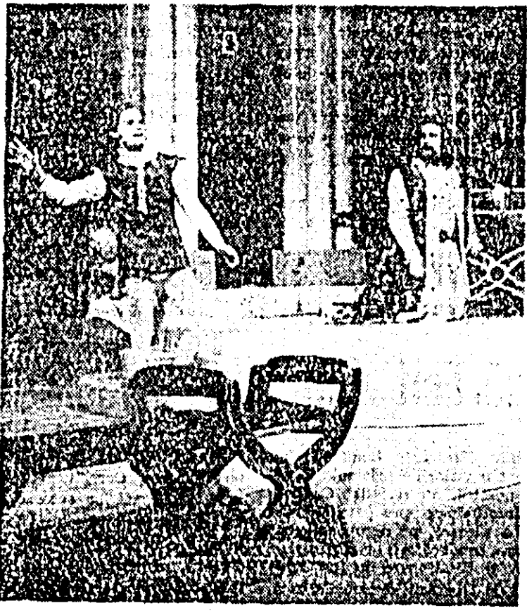
O scenă din spectacolul „Trandafirii roșii”

de nelcredere, chiar dacă linia iubită îndrăgește pe Alțineva. De aici și frumusețea morală, noblețea sufletească a personajului, ascunsă — precum în arhiva opere ale neamului românesc — îndărătul unui vestiment sărăcăș.