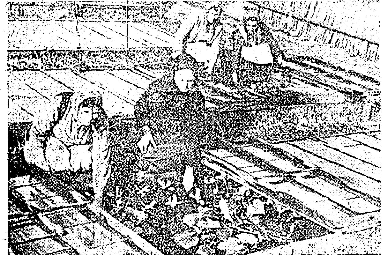
ÎN CLISEU: culturile de castraveți forțați sînt îngrijite cu pricepere de harnicele legumicultoare.