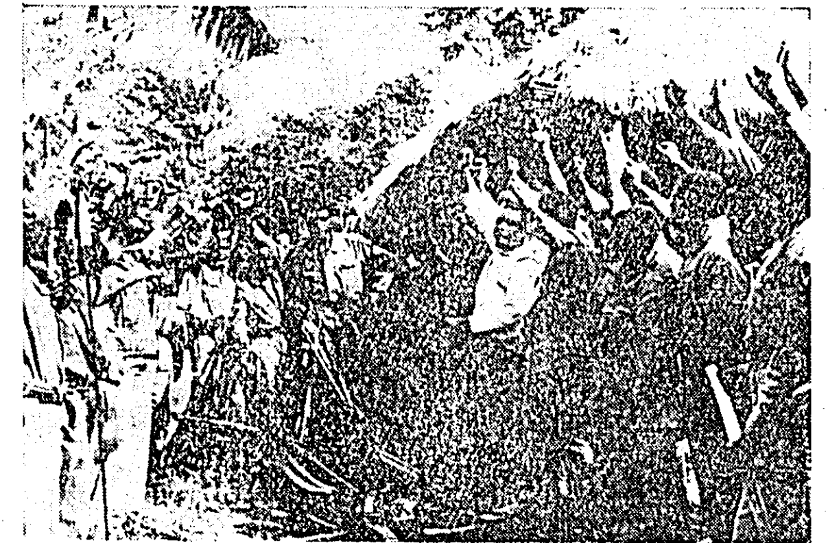
CONGO (Leopoldville) — Grup de partizani congolezi acalmînd pe tovarășii întorși victorioși dintr-o acțiune împotriva mercenarilor cărora le-au capturat armamentul.

CIUDAD DE GUATEMALA 12 (Agerpres). — Consiliul electoral din Guatemala a anunțat că în urma rezultatelor definitive ale alegerilor desfășurate la 6 martie, nici unul din cei trei candidați la postul de președinte nu a obținut majoritatea absolută, astfel încît desemnarea noului președinte al țării urmează să se facă în cadrul Congresului național. Potrivit acestor rezultate, singurul candidat civil, Julio Cesar Mendez Montenegro, reprezentînd partidul revoluționar, a obținut 190.334 voturi, colonelul Juan Dio Aguilar (Partidul democrației instituțional), sprijinit de actuala jantă militară, a înrînt 137.664 voturi, iar colonelul Miguel Angel Ponceano (asas-nimul marelui de eliberare națională) a obținut 106.325 voturi. Totodată, s-a înțeles că partidul revoluționar a câștigat 29 din cele 55 de mandate de deputați în Congres. Ca urmare a acestor rezultate încrederea forțelor de dreapta a crescut, întrucît de colonelul Aguilar, de a înlocui direct, a lui Mendez Montenegro în postul de președinte al Guatemalei par să fi reușit.