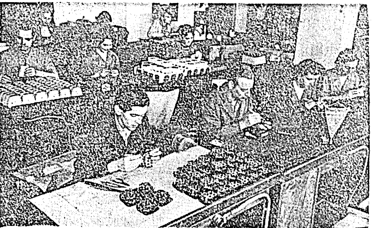
Iată-i la lucru pe cliștigătorii întrecerii pentru calitate din secția montaj.