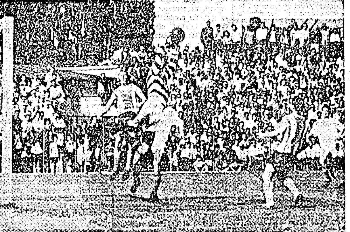
IN CLIȘEU: o fază din meciul U.T.A.—Dinamo Pitești.

Spectacolul fotbalistic desfășurat duminică pe stadionul U.T.A., a fost inaugurat de o „deschidere” frumoasă, mult agreiată de publicul spectator. S-au întlnit echipele de tineret U.T.A. și Dinamo Pitești.