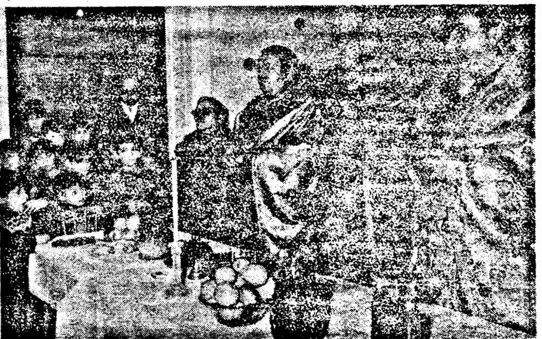
Gazde atente, micii beneficiari ai primei Case de copii în sistem familial din Sîntana asistă la sfeștania locuinței.

A marnic a mai fost „ocrotită” copilăria orfanilor României. Imagini de coșmar ne-au agresat privirile văzînd „în direct” la TV cum trăiau și erau îngrijii acești copii. De multe ori lipsa de fonduri, azvîrlită în față, pavăză, a ascuns goliciunea sufletească a educatorilor. Vă rog să mă credeți că știu ce spun. Pentru că la Casa de băieți Sîntana nu s-a întîmplat așa. Fonduri n-au avut nici ei mai multe. I-a înconjurat însă grija educatorilor și a oamenilor comunei. După Revoluție, posibilitățile de ajutor material au fost altele. Căldura și omeniile sînt constant aceleași. Lor li se