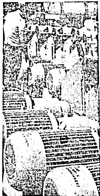
Un nou lot de utilaje pentru zootehnie ce poartă marca I.M.A.I.A. Arad.

Locul III — Consiliul popular al comunei Virfurile, cu 107 puncte.