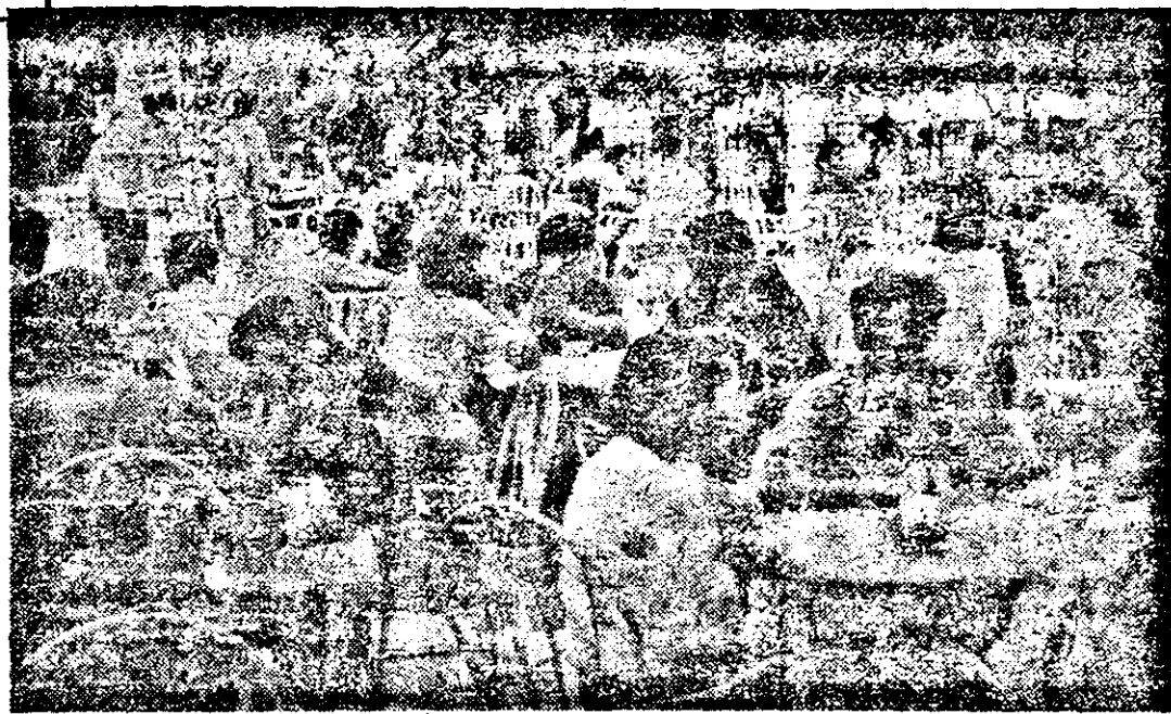
La umbră, pe asemenea căldură, ce bună ar fi o sticlă de bere!