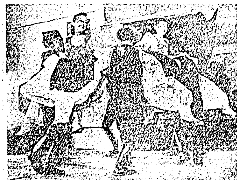
La concurs au fost prezentate jocuri populare românești, maghiare, germane. Iată un frumos dans german interpretat de dansatorii din Livada.

Timp de 12 ore în sala căminului cultural din Vinga s-a desfășurat concursul formațiilor artistice de amatori. Cel peste 2000 de artiști amatori reprezentînd 30 de cămine culturale din raion s-au antrenat într-o luptă dăruită dar aprigă pentru câștigarea dreptului de a participa la faza regio-