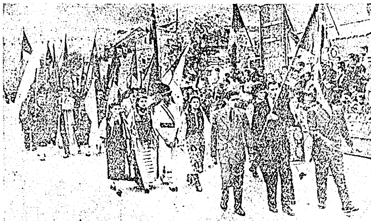
In frunte pășesc fruntași în muncă și activiști, care poartă Drapelul de luptă al Comitetului raional U.T.M.

DUMINICĂ, S-A DESFAȘURAT LA VINGA, SUB LOZINCA „PACE ȘI PRIETENIE”, FESTIVALUL RAIONAL AL TINERETULUI DIN RAIONUL ARAD. REDAM MAI JOS CITEVA ASPECTE DIN TIMPUL ACESTEI ENTUZIASTE MANIFESTĂRI A TINERETULUI.