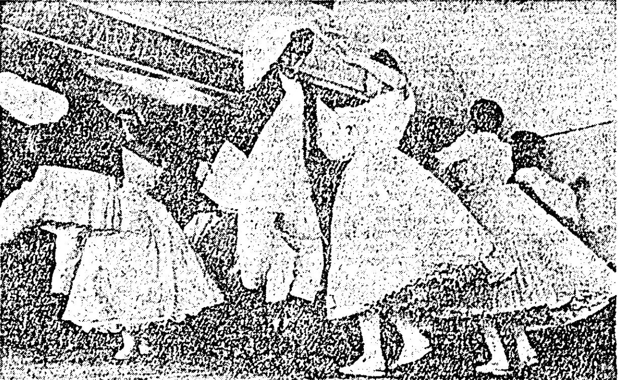
ÎN CLISEU: tineri dansat ori din Cîcir, executînd cu măiestrie un frumos joc popular local.