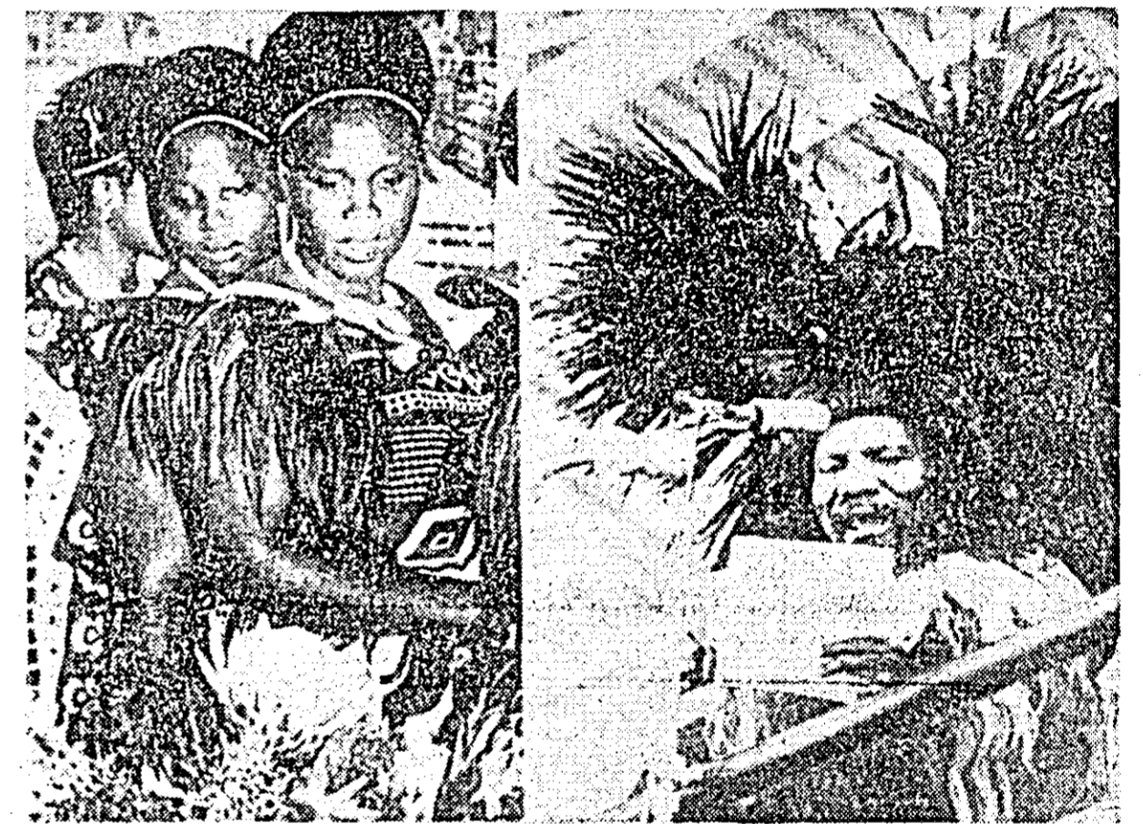
La 1 septembrie pe harta continentului negru a apărut al 40-lea stat independent — Swazi-land, ultima colonie britanică din Africa.

Aparatura de telecomunicații instalată pe bordul satelitelui, care a costat 6 milioane dolari, trebuia să permită realizarea de transmisii prin televiziune în culori a Jocurilor Olimpice de la Ciudad de Mexico spre Europa. Transmisile vor fi asigurate de alți sateliți de telecomunicații plasați anterior pe orbită.