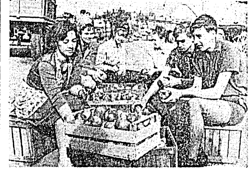
Numeroși elevi de la Liceul nr. 4 din Arad lucrează în aceste zile la I.A.S. Fintinele, ajutînd la culesul și sortatul legumelor.

Trăim într-un secol în care criza de timp a cetățeanului modern este evidentă. Dar de ce tot mai la farmacia s-a ajuns să se aștepte la rînd?