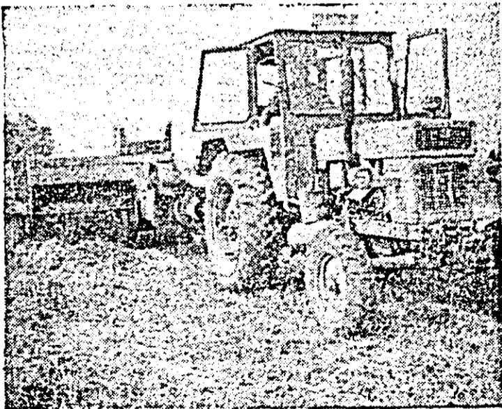
C.U.A.S.C. Sintana. Presele acționează operativ la balotatul paielor.