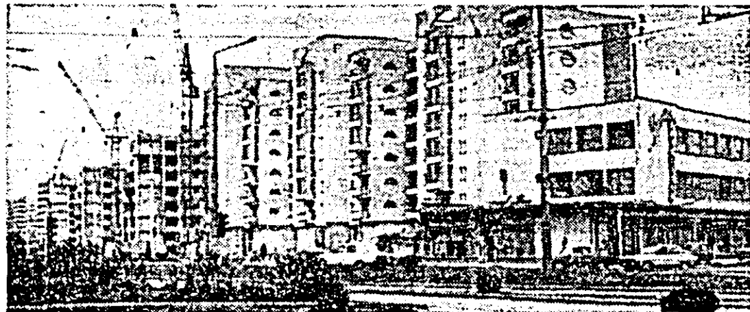
În construcție, noi blocuri de locuințe în zona Vlaicu.