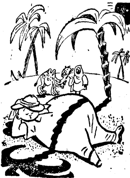
a „pálmák árnyékában”.