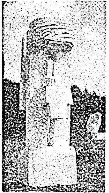
D. Șerban: „Piatră de hotar”.