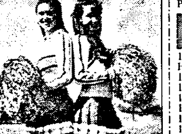
RTL-21,15 Clubul mincișoșilor - f. SUA 1993

15,25 Orice, numai dragoste nu! - s.am.: Impotriva omului animalic 15,55 Star Trek - s. sf. am. Puternicul 16,55 Legea străzii - s. act. am.: Bani pentru protecție