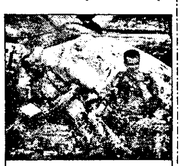
PRO7-23,10 Atacul intruderilor - f. act. SUA 1990

7,50 Cei trei din Riptide - s.am. - rel. 8,30 Des. anim. 12,45 Pantera roz - s.