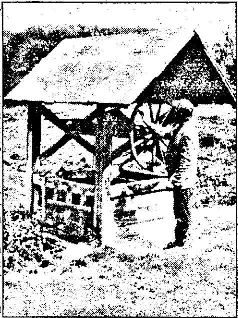
De la această fântână, construită „pe vremea turcilor”, cei 12 locuitori ai Varniței se aprovizionează cu apă potabilă. Iar din sat până în vale, la fântână, e ceva drum...

apoi doar pădure. Locuri de un pitoresc aparte, de o frumusețe sălbatică. Umezeală, multă umezeală, iar drumul e presărat cu bălți și noroaie. Unele pot fi ocolite, altele sunt late cât drumul. Și adânci. Străbătem vreo trei kilometri de astfel de drum pe care nu-ți dorești să-l mai întâlnești vreodată în viață, apoi...ne împotmolim. Mașina se afundă rău de tot, și doar îndemânarea