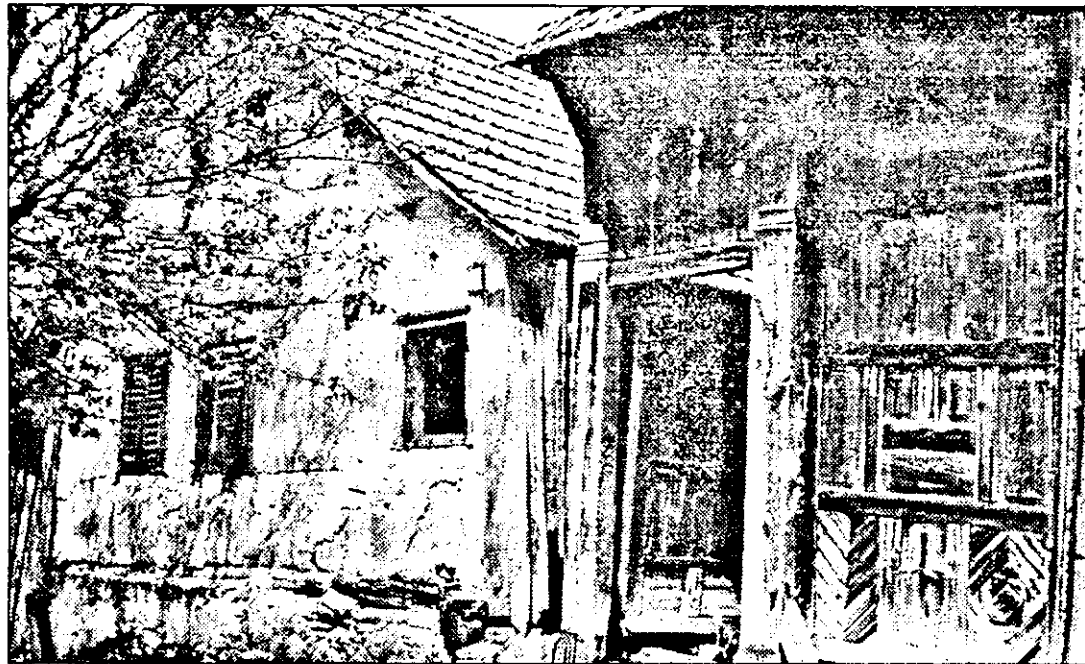
Fără curent electric, fără școală și biserică, fără nici o legătură cu localitățile învecinate, satul Varnița s-a depopulat. Au rămas doar casele goale, pustii, ajunse acum în paragină.