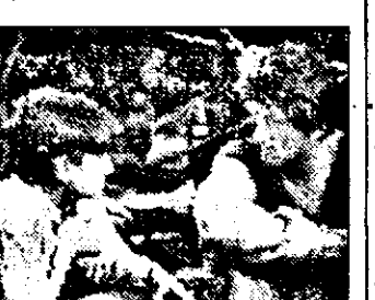
PRO7-21,15 Over The Top - f. SUA 1987

7,00 Reflectii 8,00 Artă africană 8,30 Curs de lb. franceză 9,05 Jurnal Canada