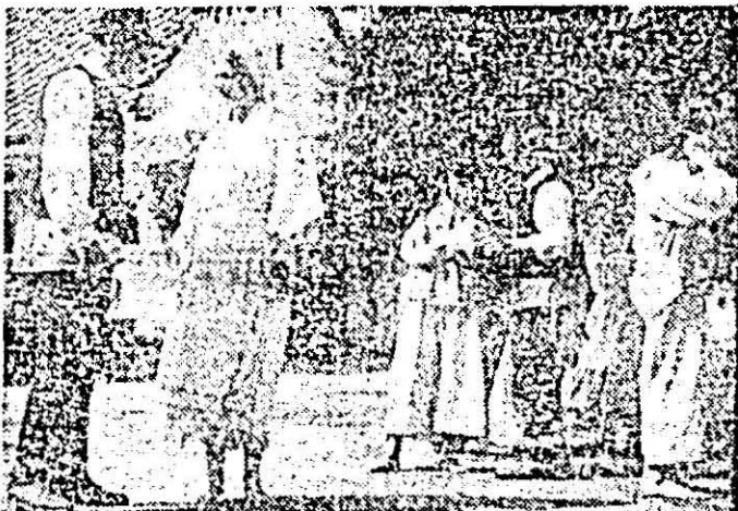
Secvență din timpul filmărilor.